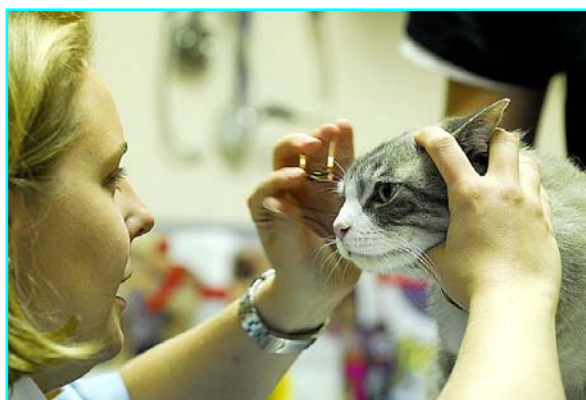
Examen oculaire d'un chat par son vétérinaire.

Le diagnostic repose avant tout sur les éléments épidémiologiques et les constatations cliniques réalisées par un vétérinaire. Ce dernier peut confirmer l'infection par différentes techniques de laboratoire, dont la PCR. L'interprétation des résultats peut être délicate selon les cas.