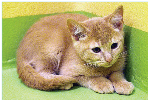
Chaton abattu, en début d'évolution de la maladie sous sa forme classique. Noter la prostration dans un coin de la pièce.

Certains chats arrivent à compenser ces anomalies. L'infection des très jeunes chatons sans anticorps maternels peut conduire aux mêmes effets.