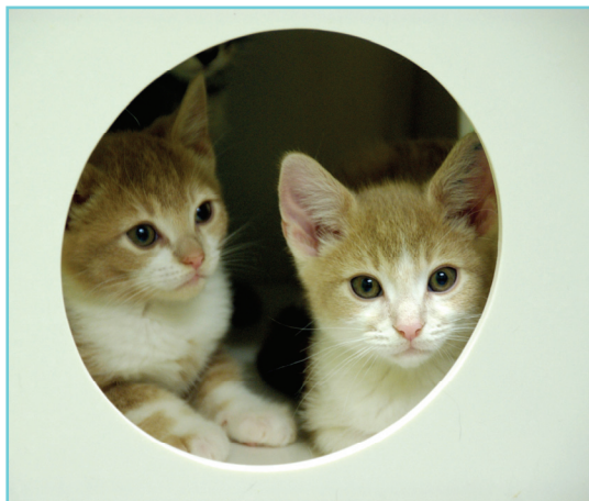
Regroupement des animaux selon leur âge.