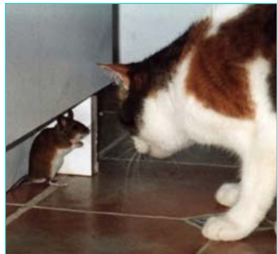
Le chat s'infecte principalement par la consommation de souris.