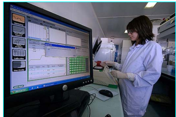
Les analyses biologiques nécessitent du matériel spécialisé. (© Merial).